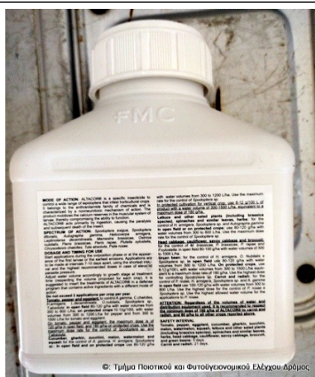
© Τμήμα Ποιότητας και Φυτογενετικού Ελέγχου Αγρούς