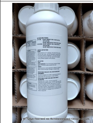
© Τμήμα Ποιότητας και Φυτογενετικού Ελέγχου Αγρούς