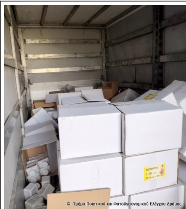
© Τμήμα Ποιότητας και Φυτογενετικού Ελέγχου Αγρούς