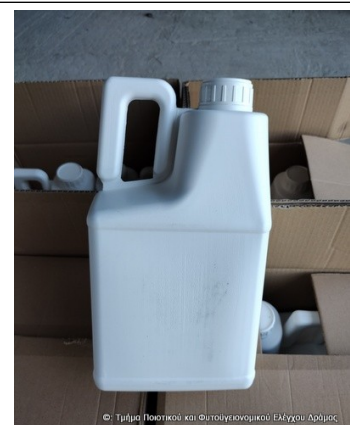
© Τμήμα Ποιότητας και Φυτογενετικού Ελέγχου Αγρούς