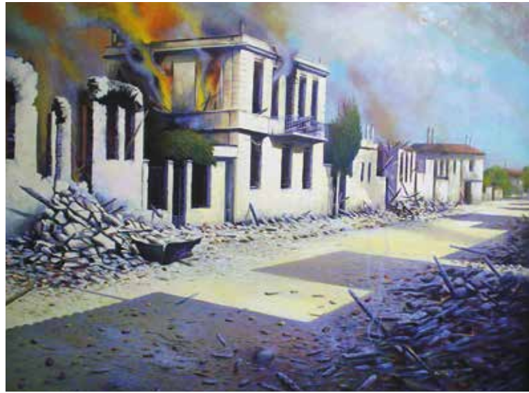
Παναγιώτης Βαφειάδης - Δημοτικό Σχολείο Δοζάτου