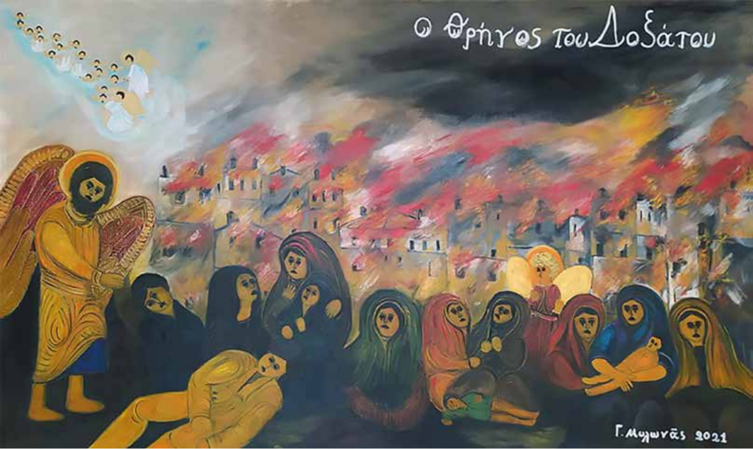
Θρήνος Δοζάτου - Μυλωνάς Γεώργιος - Πνευματικό Κέντρο Δοζάτου