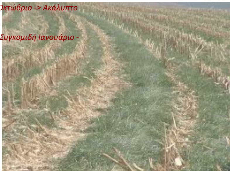
Εικόνα 4. Έδαφος καλυμμένο με καλαμιά και αυτοφυή βλάστηση

ΥΠΟΥΡΓΕΙΟ ΑΓΡΟΤΙΚΗΣ ΑΝΑΠΤΥΞΗΣ & ΤΡΟΦΙΜΩΝ Δ/ΝΣΗ ΠΕΡΙΒΑΛΛΟΝΤΟΣ ΧΩΡΟΤΑΞΙΑΣ & ΚΛΙΜΑΤΙΚΗΣ ΑΛΛΑΓΗΣ ΤΜΗΜΑ ΠΡΟΣΤΑΣΙΑΣ ΦΥΣΙΚΩΝ ΠΟΡΩΝ ΑΠΟ ΑΓΡΟΤΙΚΕΣ ΔΡΑΣΤΗΡΙΟΤΗΤΕΣ