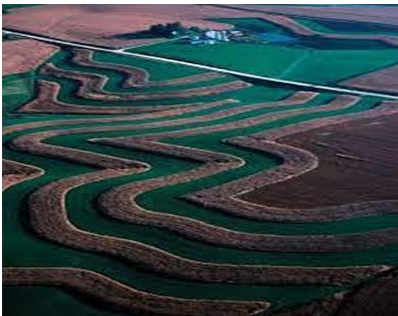
Εικόνα 1 Ιδανική καλλιέργεια κατά τις ισοΰψεις