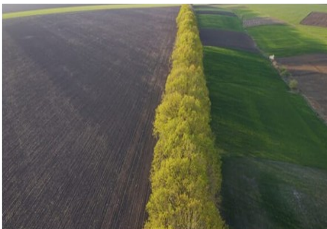
Εικόνα 3 Αγροτεμάχιο με κλίση και ζώνη ανάσχεσης φυτεμένη με θάμνους ή δένδρα

Τα αγροτεμάχια με αναβαθμίδες καθώς δεν διατρέχουν κίνδυνο διάβρωσης.